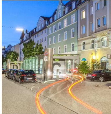
Automatische Anwohner Tiefgarage